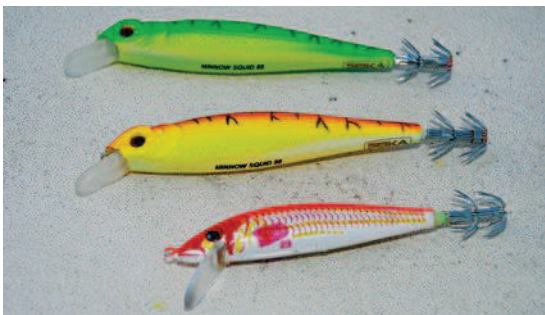
Kalmar-Wobbler mit Tauchschaufel zum Schleppen oder Molenangeln. Im Hakenkranz verfangen sich die Tentakel

daneben. Um einen Kopffüßer zum Anbiss zu bringen, ist ein sensibles Köderspiel Voraussetzung. Das hat einen einfachen Grund: Die Kalmar-Wobbler imitieren nämlich Garnelen. Die Schalentiere stehen bei Kalmaren ganz oben auf der Speisekarte, vor allem wenn sie sich häuten. Um