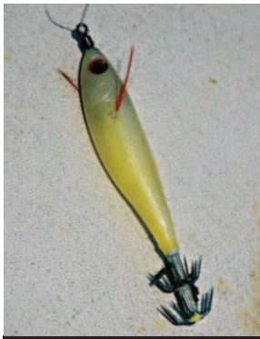
Kalmar-Wobbler ohne Tauchschaufel imitieren Garnelen. Sie werden am Seitenarm gefischt

Wer nun denkt, Kalmar-Angeln sei ein lustiges Kinderspiel, liegt gründlich