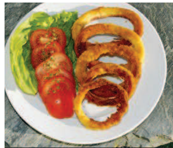
Sehr delikat: Tintenfischringe (sog. „Runderneuerte“) werden aus dem Mantel des Kalmars hergestellt

den alten Panzer loszuwerden, schwimmen Garnelen in der Häutungsphase wellenförmig. Genau so sollte sich auch unser Köder durch leichtes Heben und Senken der Rute bewegen. Zusätzlich holt man in kürzeren Abständen ein paar Kurbelumdrehungen ein.